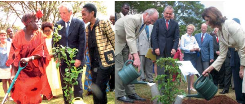
Wangari Maathai, Friedensnobelpreisträgerin und Klaus Töpfer, ehemaliger Exekutiv-Direktor des UN-Umweltprogramms UNEP